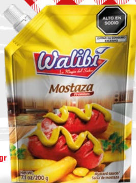
Premium Mustard Doypack 200gr