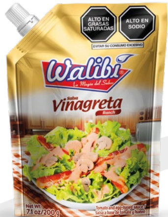
SAUCE VINAGRETA RANCH Doypack 200 gr

Salsa vinagreta a base de: huevo, aceite, tomate, piña, tamarindo, mostaza, pimienta y jugo de limón. Es ideal para acompañar ensaladas con carne de pollo, pavo o res o para disfrutar con dedos de queso, tequeños o los piqueos de tu preferencia.