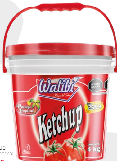
Ketchup of peruvian tomatoes Bucket 4Kg