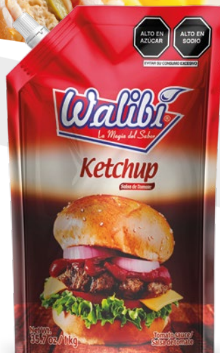
Ketchup of peruvian tomatoes Doypack 1000cm 3

Es una salsa a base de tomate cuyos ingredientes son: el tomate, vinagre, azúcar, sal y diversas especias. Su peculiar sabor agrídulce lo hace combinable con diversos tipos de comidas como: hamburguesas, hot dogs, salchipapas y todo aquello que tu creatividad y ganas de disfrutar lo sugieran.