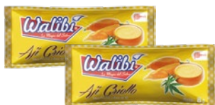
Ají Criollo Yellow pepper Sachets 8 gr