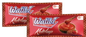
Ketchup of peruvian tomatoes Sachets 8gr