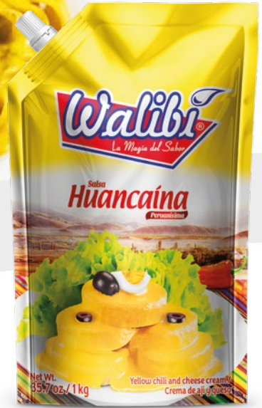
Huancaína Huancaína Sauce Doypack 1000 cm 3

Esta riquísima salsa es una de las más populares del Perú, está hecha a base de ají amarillo, leche, aceite, queso fresco y sal. Se sirve generalmente con papa sancochada acompañada de un huevo duro, un par de aceitunas negras y se presenta sobre hojas de lechuga. También es habitual servirla como salsa acompañante para pastas y para el clásico sancochado peruano.