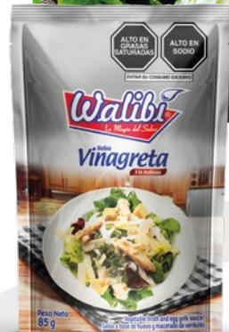
Vinaigrette sauce Italian style Doypack 85 gr