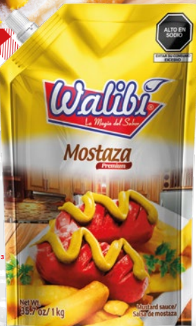
Premium Mustard Doypack 1000cm³