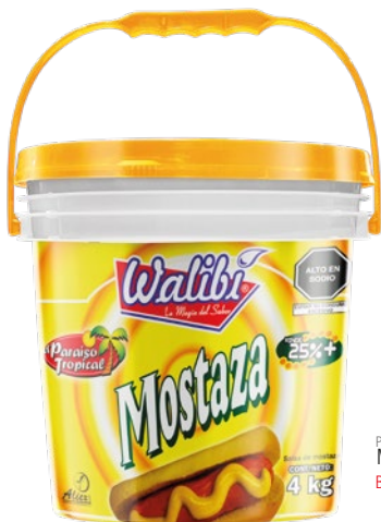
Premium Mustard Bucket 4kg