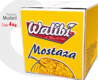
Premium Mustard Caja 4kg