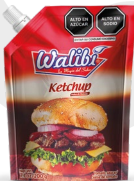
Ketchup of peruvian tomatoes Doypack 200gr