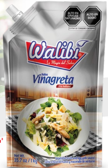
Vinaigrette sauce Italian style Doypack 1000 cm 3