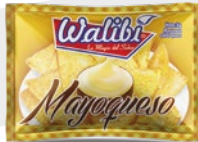
Mayoqueso cheese flavored mayonnaise Sachets 5gr