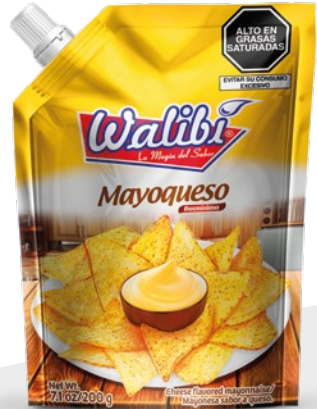
Mayoqueso Doypack 200 gr

Mayoqueso es una salsa de mayonesa saborizada con queso que resulta espectacular como acompañamiento para todo tipo de sándwiches, hamburguesas, hot dogs, papas fritas, snacks o ensaladas frías. Esta salsa es el perfecto sustituto del queso teniendo como plus que es mucho más sabrosa, económica y es súper práctica y fácil de almacenar. Esta salsa es el complemento perfecto en distintas ocasiones desde un pickeo para compartir en una reunión con amigos, hasta después de un día agitado como acompañamiento de un snack rápido como un sandwich o un taco.