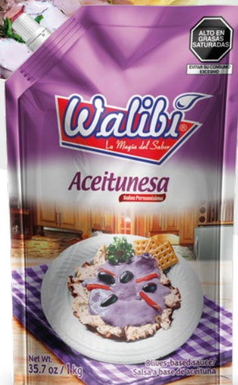
Olive mayonnaise mayonnaise with olive Doypack 1000 cm 3

Es una crema preparada mediante la combinación de mayonesa y pulpa de aceituna que da como resultado una peculiar salsa de sabor astringente. Esta salsa tiene un fuerte sabor que resalta fácilmente en cualquier tipo de comida como sanchuches, tacos o snacks. Es muy versátil, al ser diluida con aceite de olivo se obtiene la salsa de olivo usada en platos muy populares en la gastronomía peruana como pulpo al olivo o tiradito de pescado.