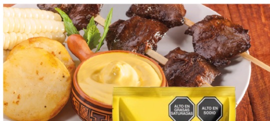
Ají Criollo Yellow pepper Doypack 85 gr