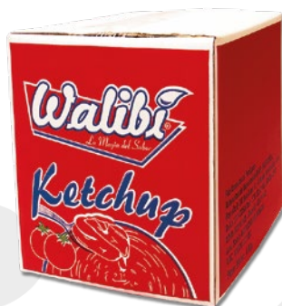
Ketchup of peruvian tomatoes Caja 4Kg