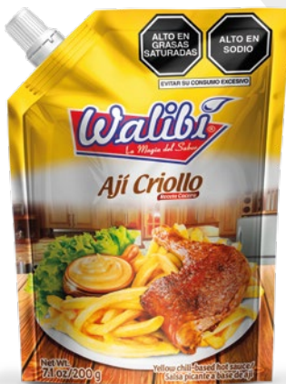
Ají Criollo Yellow pepper Doypack 200 gr