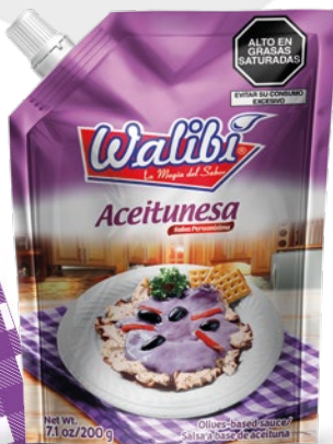
Doypack 200 gr Olive mayonnaise mayonnaise with olive