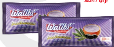
Olive mayonnaise mayonnaise with olive Sachets 8 gr