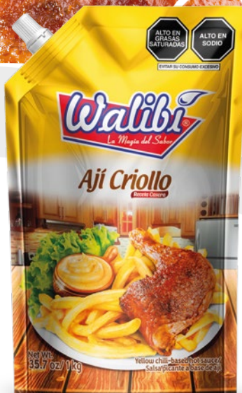
Ají Criollo Yellow pepper Doypack 1000 cm 3

Es una cremosa combinación de ají amarillo, aceite vegetal, huevo, cebolla, ajo, huacatay y otras especias que le dan un rico y gustoso sabor picante. Este producto es combinable con la mayoría de los platos de la gastronomía peruana. Es un perfecto acompañamiento por su versatilidad que combina perfecto con preparaciones simples como unas papas fritas hasta preparaciones más elaboradas como arroz con pollo, anticuchos, pollo a la brasa, papa rellena, entre otros.