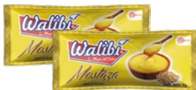
Premium Mustard Sachets 8gr