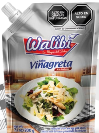
Vinaigrette sauce Italian style Doypack 200 gr